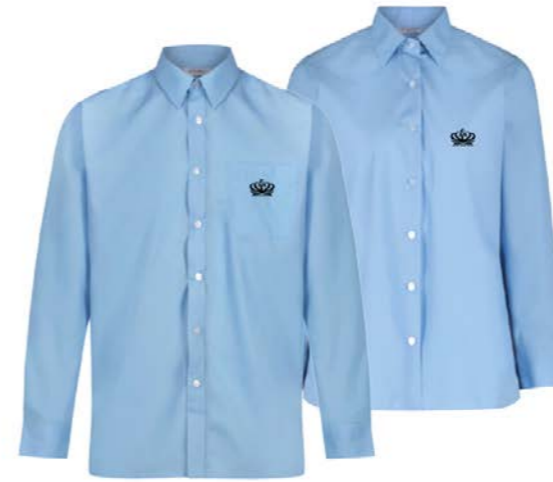
파란색 긴 팔 셔츠/블라우스 NLS/NLB-BLU 배지 SB32/SB1