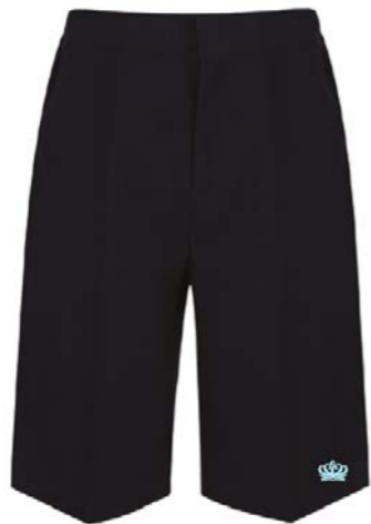
남색 상급생 반바지 TSH-NVY 배지 BT14