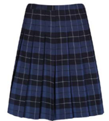
스티치 다운 주름 치마 GST-PEN