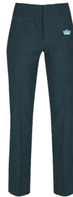
상급생 붙는 타입 바지 GTI-NVY 배지 GT12