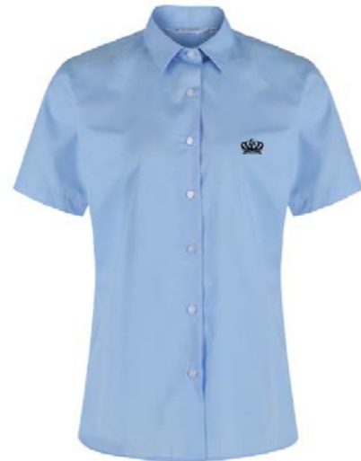
파란색 반팔 블라우스 NSB-BLU 배지 SB1