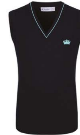
남색 면 조끼 SCBT N1 하늘색 라인 배지 KN1