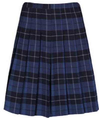
스티치 다운 주름 치마 GST-PEN