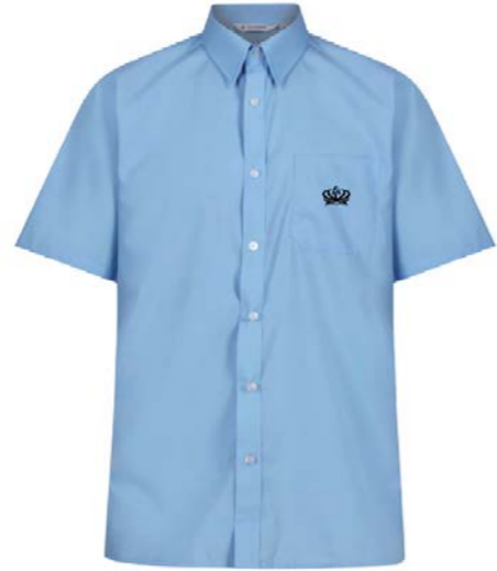
파란색 반팔 셔츠 NSS-BLU 배지 SB32