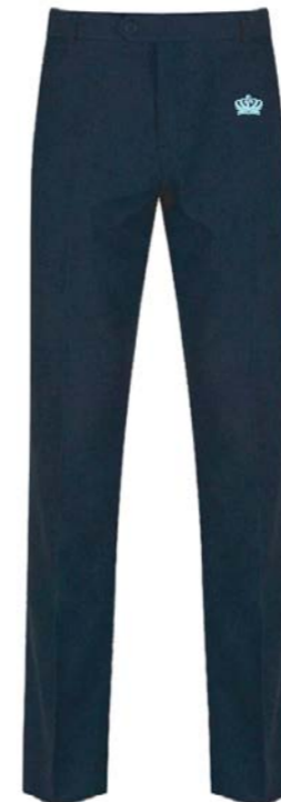
상급생 바지 TLT-NVY 배지 BT4