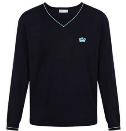
남색 면 브이넥 점퍼 SCBV N1 및 C14 하늘색 라인 배지 KN1